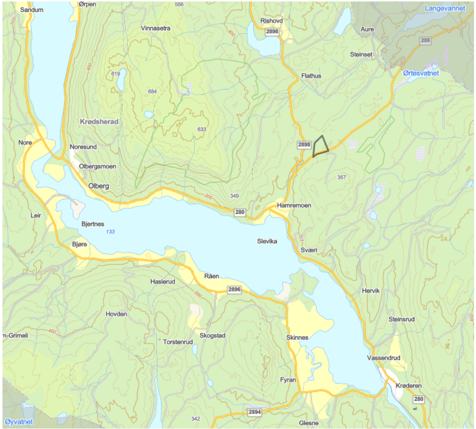
Figur 1: Oversiktskart