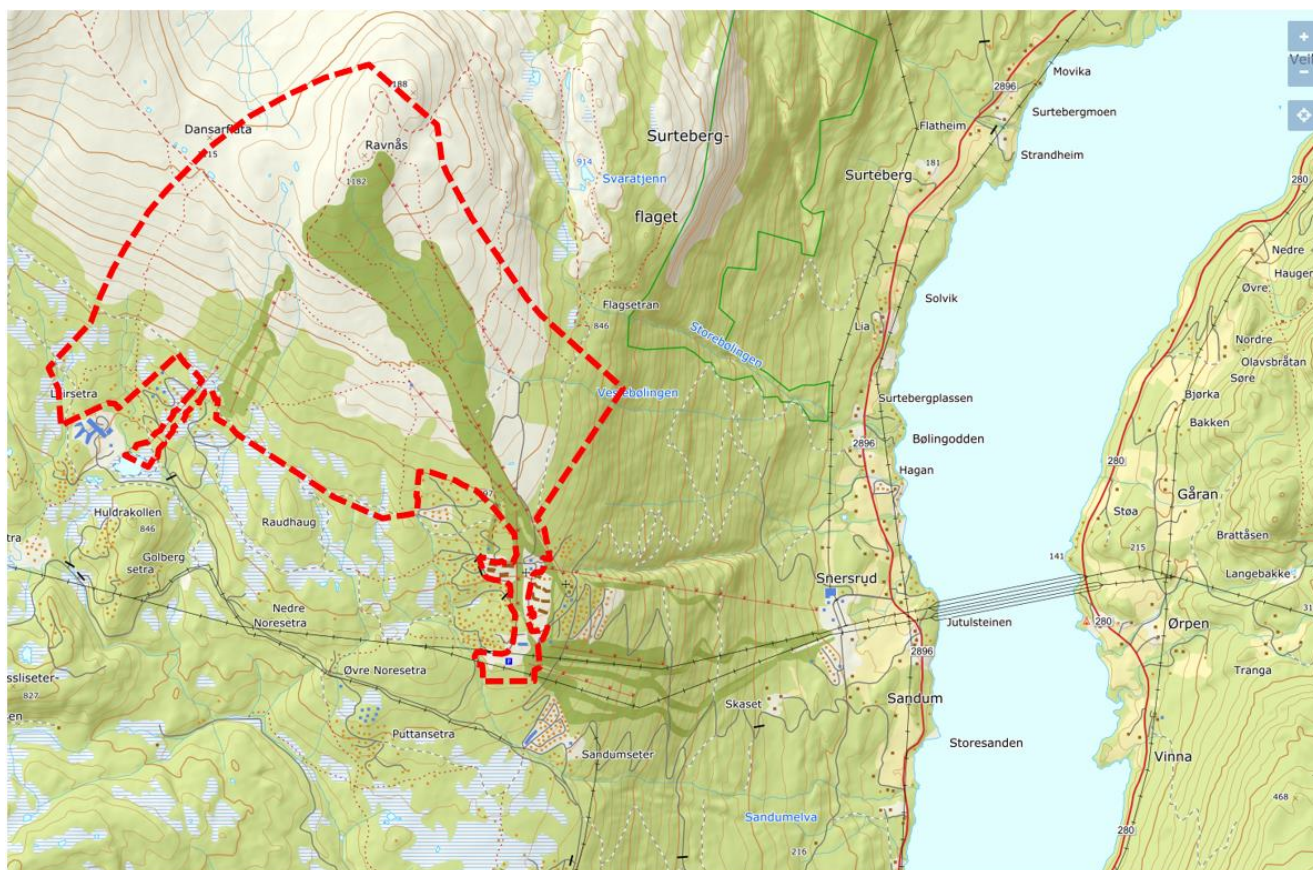
Oversiktskart med planområdets plassering

Iht Plan- og bygningslovens § 12-8 varsles oppstart av reguleringsplanarbeid i Krødsherad kommune. Det varsles også om at det blir satt i gang arbeid med utbyggingsavtale etter pbl kap. 17.