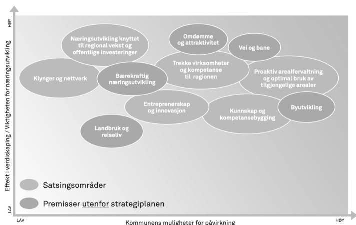
Figur 1: Strategiske satsingsområder

Modellen er ment som et verktøy for å prioritere innsats, og avklare kommunens rolle/ innretning på tiltak på de ulike områdene. Områder hvor antatt effekt på verdiskaping er høy og kommunens mulighet for påvirkning er stor, vil være områder for åpenbar prioritering. «Proaktiv arealforvaltning og optimal bruk av tilgjengelige arealer» er et slikt område.